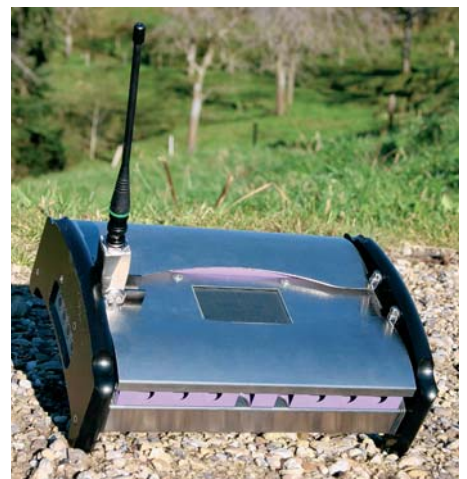
Zündsteuergerät für Feuerwerke mit TRX 433-10

◆ In Kategorie A müssen einige Byte bis wenige Kilobyte Daten pro Nachricht über RS 232 von einem Gerät zum anderen sicher übertragen werden (z.B. vom PC zu Displays, Drucker usw.). Das Timing ist dabei unkritisch. Das Modul soll ohne zusätzliche Software verwendbar sein.