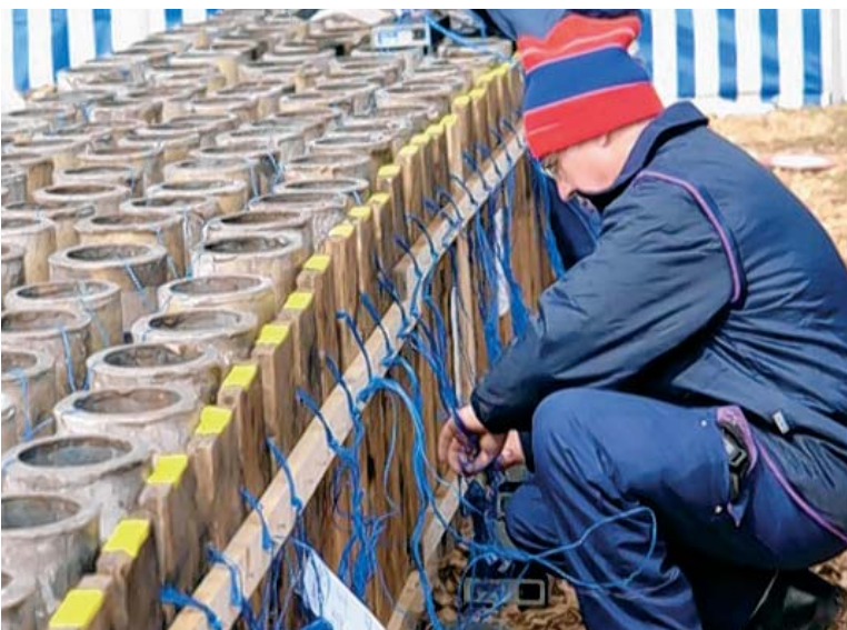
Aufbau und Verdrahtung einer Abschussrampe mit den Zündsteuergeräten